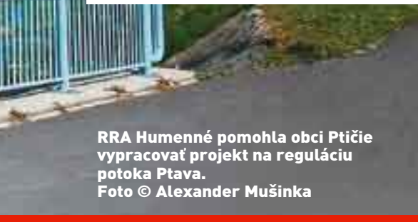
RRA Humenné pomohla obci Ptičie vypracovať projekt na reguláciu potoka Ptava.

tra pre Centrálny koordinačný orgán (MVRR SR) pre operačné programy v NSRR SR na roky 2007 – 2013, zabezpečenie a aktualizácia jednotného zásobníka projektov z územia pôsobnosti agentúry, vypracovanie a aktualizácia analýzy potenciálu regiónu na území pôsobnosti agentúry, poskytovanie informácií, hľadanie vhodných projektových partnerov a zabezpečenie projektového rozvoja v rámci programov cez-hraničnej spolupráce. Ďalšími našimi aktivitami je aj tvorba a spracovanie projektových a podnikateľských zámerov pre žiadateľov, vypracovanie a realizácia vlastných projektov, organizovanie odborných seminárov a rekvalifikačných kurzov. Spolupracujeme s domácimi aj zahraničnými inštitúciami podieľajúcimi sa na tvorbe a rozvoji regionálnej politiky. Ako partner sme vystupovali vo viacerých, či už národných, medzinárodných alebo v euroregionálnych projektoch. Počet projektov, ktoré nám za tie roky prešli cez ruky, by sa dal počítať na stovky. Len podnikateľských zámerov sme do konca minulého roku vypracovali takmer dvesto a ostatných projektov bolo len o niekoľko desiatok menej," dodáva.