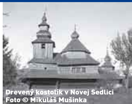
Drevený kostolík v Novej Sedlici

Na ich vzniku sa nemalou mierou podieľalo aj to, že vo všetkých prípadoch ide o regióny, ktoré sú mnohonásobne marginalizované. Ide o regióny označované ako: teritoriálne na okraji a regióny s najvyššou mierou nezamestnanosti na Slovensku, kde je veľmi málo rozvinuté podnikateľské prostredie, infraštruktúra a pod. (napríklad región Svidníka je jediným regiónom na Slovensku, ktorý vôbec nemá rozvinutú železničnú sieť). Ich marginalizovaná pozícia je okrem toho „ukotvená“ i v historickej tradícii. Aj v minulosti išlo o veľmi chudobné regióny, výrazne agrárne orientované, so značne obmedzenými lokálnymi zdrojmi. Boli to regióny výraznou mierou zasiahnuté pracovnou migráciou alebo vystaňovalctvom. Len na okraj spomeňme odchod za prácou na Dolnú zem, vystaňovalctvo do Ameriky, či drotárstvo v dávnejšej minulosti. V súčasnosti je to ešte vždy aktívne