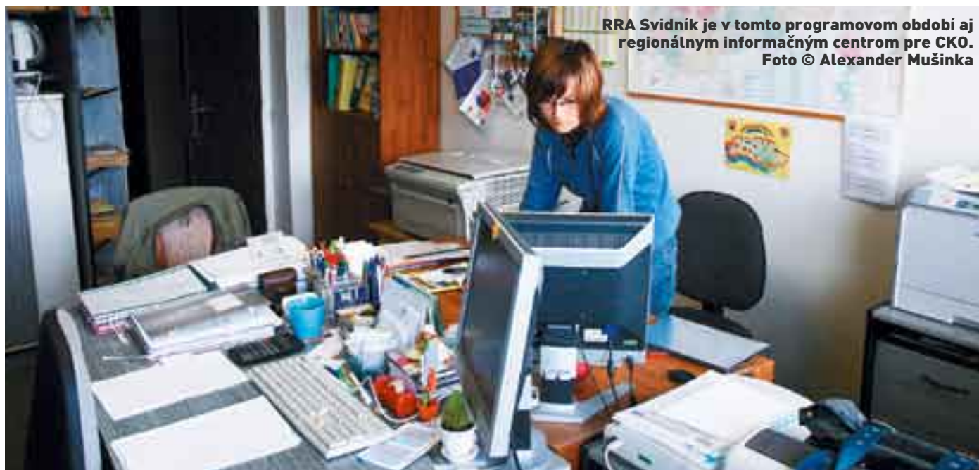
RRA Svidník je v tomto programovom období aj regionálnym informačným centrom pre CKO.