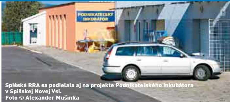
Spišská RRA sa podieľala aj na projekte Podnikateľského inkubátora v Spišskej Novej Vsi.

„Spiš má jednak z historického pohľadu, ale aj z hľadiska súčasných vývojových trendov jednoznačné predpoklady na rozvoj cestovného ruchu a turistická infraštruktúra je už na relatívne slušnej úrovni.“