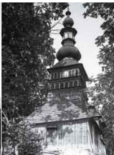
Drevené kostolíky sú veľkým turistickým potenciálom východného Slovenska. Na záberoch Floriana Zapletala z 20. rokov minulého storočia ich vidíme v pôvodnom stave.